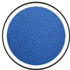
Azurblau +160,- €

Die weiße Holzplatte kann auf Wunsch mit einem Billardtuch bezogen werden. Unter dem Tuch verlegen wir eine dünne, elastische Matte, damit Sie Karten und Spielmaterialien leichter aufnehmen können.