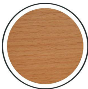
Buche natur +0,- €