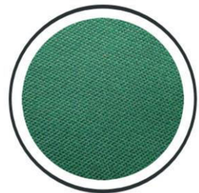
Royalgrün +160,- €

Das Tuch ist geeignet für jedes Spiel, pflegeleicht und strapazierfähig.