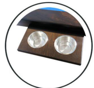
Doppelhalter +80,- €