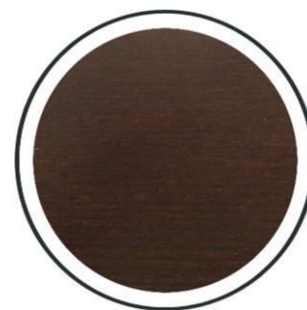
Nussbaum +200,- €