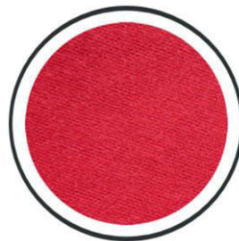
Weinrot +160,- €