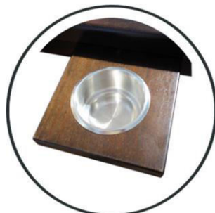
Becherhalter +70,- €